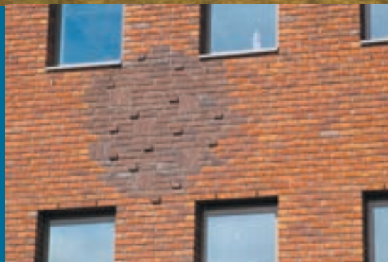
Gemetselde vlek is opgebouwd uit andere kleurenmix en uitstekende stenen