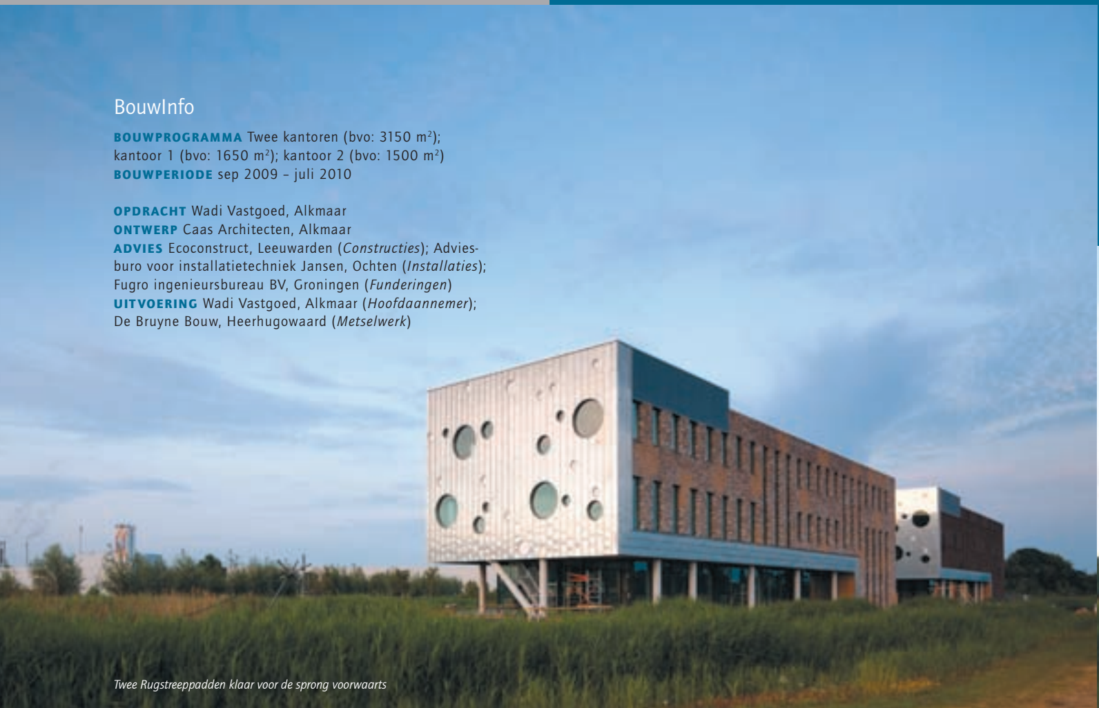
Twee Rugstreeppadden klaar voor de sprong voorwaarts

UITVOERING Wadi Vastgoed, Alkmaar ( Hoofdaannemer ); De Bruyne Bouw, Heerhugowaard ( Metselwerk )