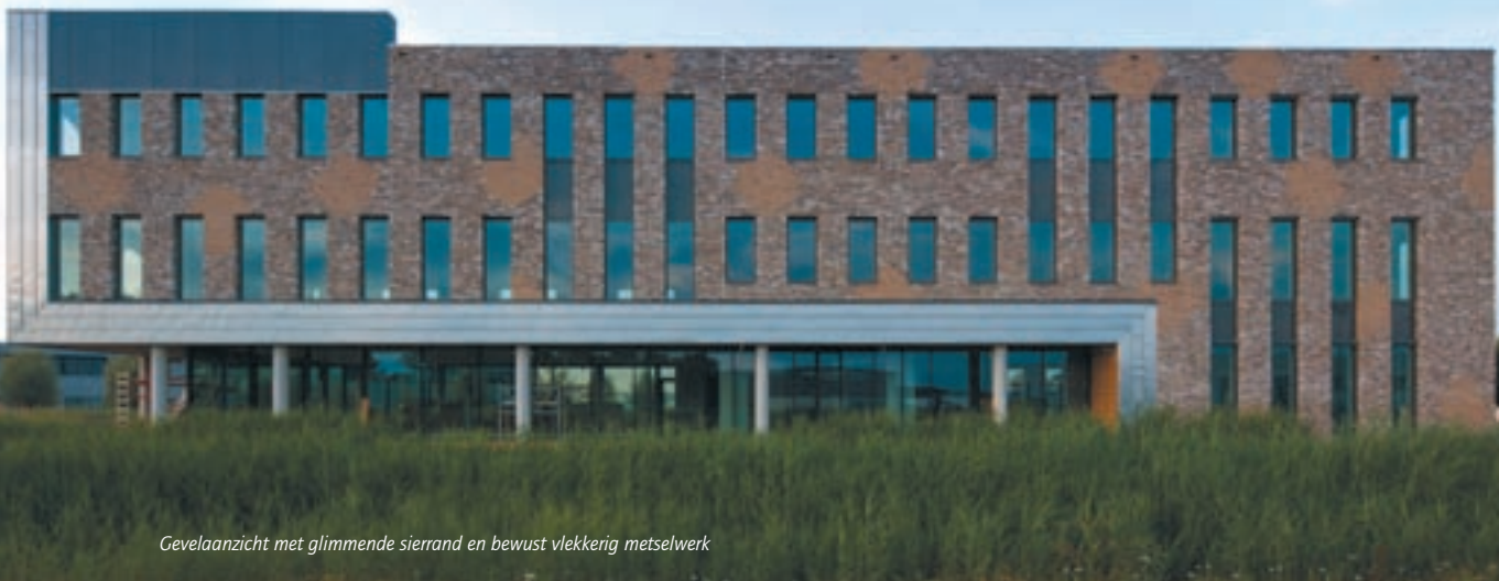
Gevelaanzicht met glimmende sierrand en bewust vlekkerig metselwerk